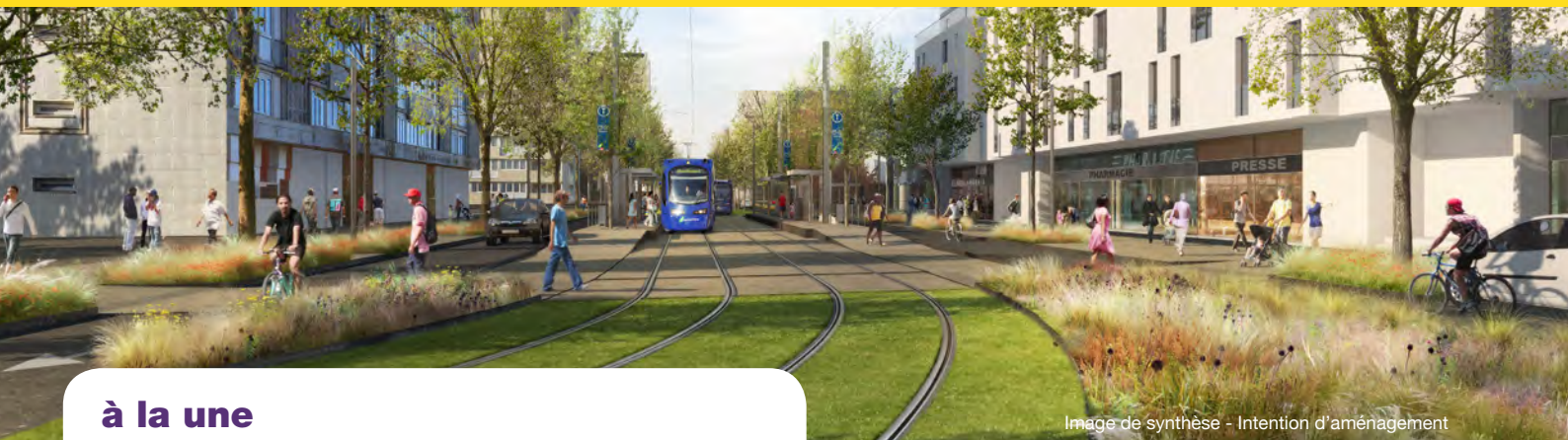
Image de synthèse - Intention d'aménagement