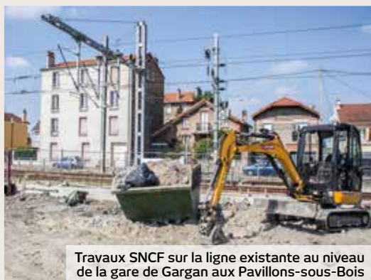
Travaux SNCF sur la ligne existante au niveau de la gare de Gargan aux Pavillons-sous-Bois