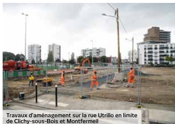
Travaux d'aménagement sur la rue Utrillo en limite de Clichy-sous-Bois et Montfermeil