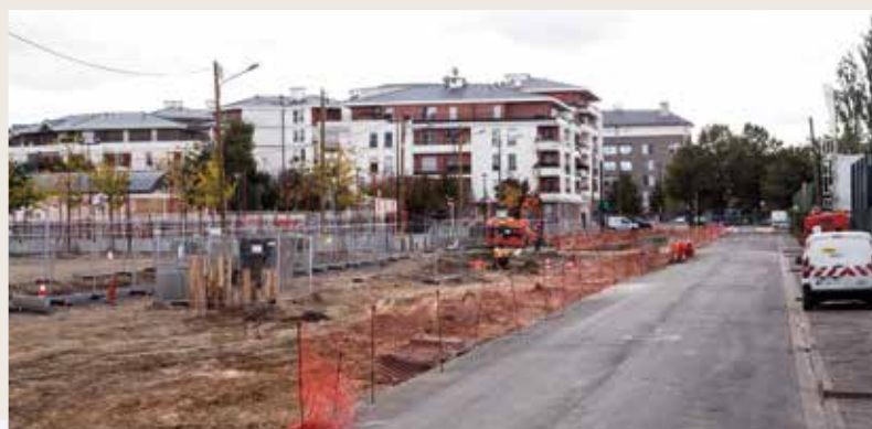
Travaux d'aménagement sur la rue Utrillo en limite de Clichy-sous-Bois et Montfermeil