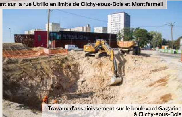
Travaux d'assainissement sur le boulevard Gagarine à Clichy-sous-Bois

Retrouvez toutes les images dans la photothèque sur : www.tramway-t4.fr