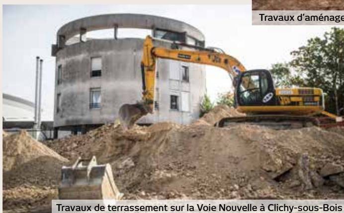
Travaux de terrassement sur la Voie Nouvelle à Clichy-sous-Bois