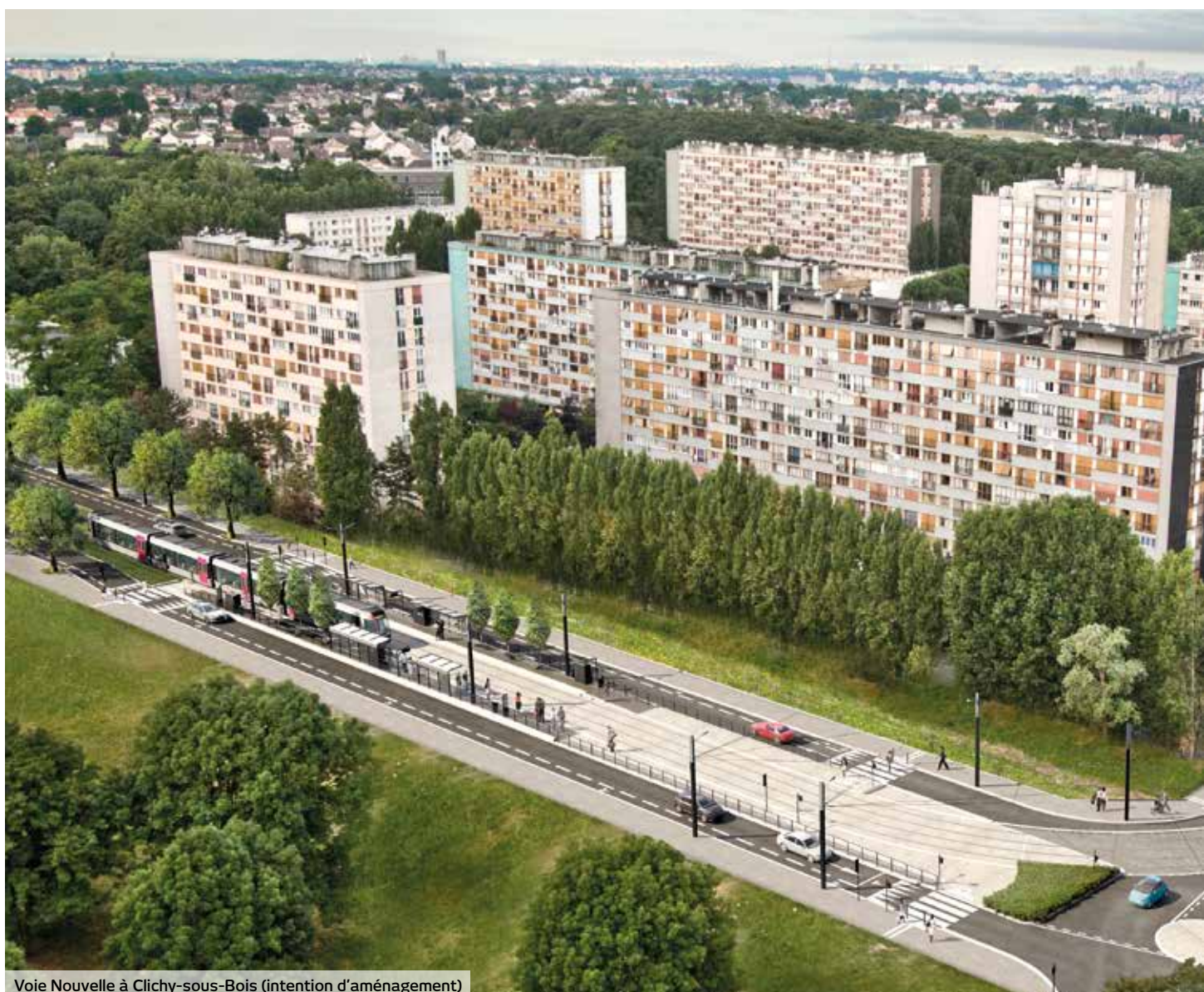
Voie Nouvelle à Clichy-sous-Bois (intention d'aménagement)