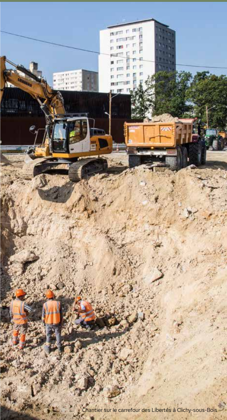
Chantier sur le carrefour des Libertés à Clichy-sous-Bois

Présidente de la Région Île-de-France, Présidente du STIF