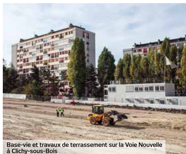
Base-vie et travaux de terrassement sur la Voie Nouvelle à Clichy-sous-Bois

Une troisième zone de travaux s'est également ouverte sur la rue Utrillo, en limite de Clichy-sous-Bois et de Montfermeil, afin d'aménager voiries et trottoirs avant de construire la plateforme du tramway.